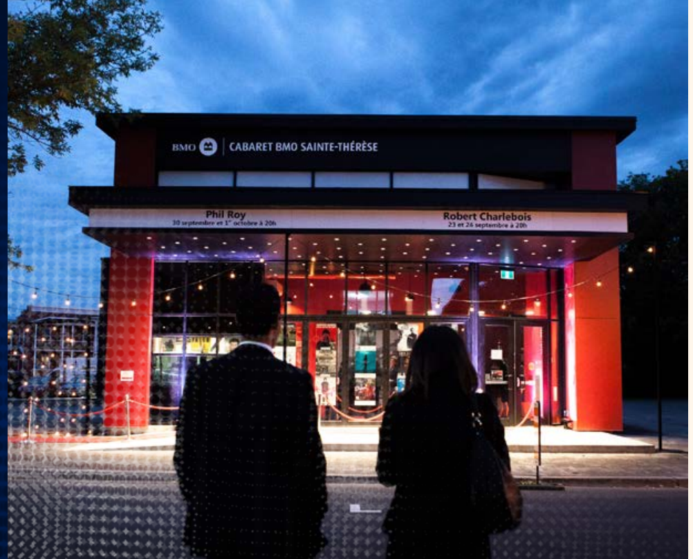
Sainte-Thérèse, Cabaret BMO Sainte-Thérèse